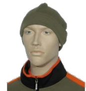
Roll-Mütze Layer 1